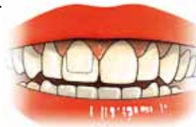
Een kroon over een voortand