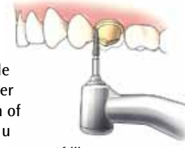
Afslipen van de tand of kies

Allereerst wordt een deel van de tand of kies afgeslepen, totdat er genoeg ruimte is om een kroon of brug te maken. Zo nodig krijgt u een plaatselijke verdoving.