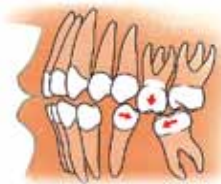
Zij aanzicht van een kaak: uitgroeien en scheef gaan staan van kiezen

Als tanden en kiezen ontbreken, kunnen de tanden of kiezen van de andere kaak in de richting van de open ruimte groeien. Ook kunnen de tanden of kiezen aan weerszijden van de open ruimte naar elkaar toe groeien, waardoor ze scheef gaan staan.