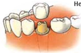
Kroon, een kapje over een tand of kies

Het kapje zit op de tand of kies vastgelijmd. Door een kroon krijgt de tand of kies zijn oorspronkelijke vorm en functie weer terug.