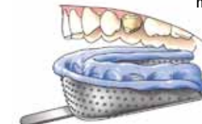
Afdrukkelpel met afdruk materiaal

Vervolgens maakt de tandarts een afdruk van uw hele kaak of het gedeelte waarin zich de afgeslepen kies bevindt. Hiervoor brengt de tandarts een afdrukkelpel met een rubberachtige massa in uw mond. Zo ontstaat een afdruk waarin later in een tandtechnisch laboratorium gips wordt gegoten. Op dit gipsmodel wordt de kroon of brug gemaakt.