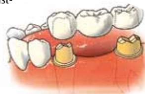
Brug: twee kronen, die op de pijlers passen en een brugtussendeel

Een brug wordt gemaakt ter vervanging van één of meer ontbrekende tanden en/of kiezen. Een brug zit vast aan twee of meer pijlers. Dat zijn afgeslepen tanden of kiezen aan weerszijden van de open ruimte van de ontbrekende tand of kies. Een brug bestaat uit twee of meer kronen die op pijlers passen en een brugtussendeel, ook wel 'dummy' genoemd. Deze bestaat uit één of meer kunsttanden en/of kiezen die op de plaats van de open ruimte komen.